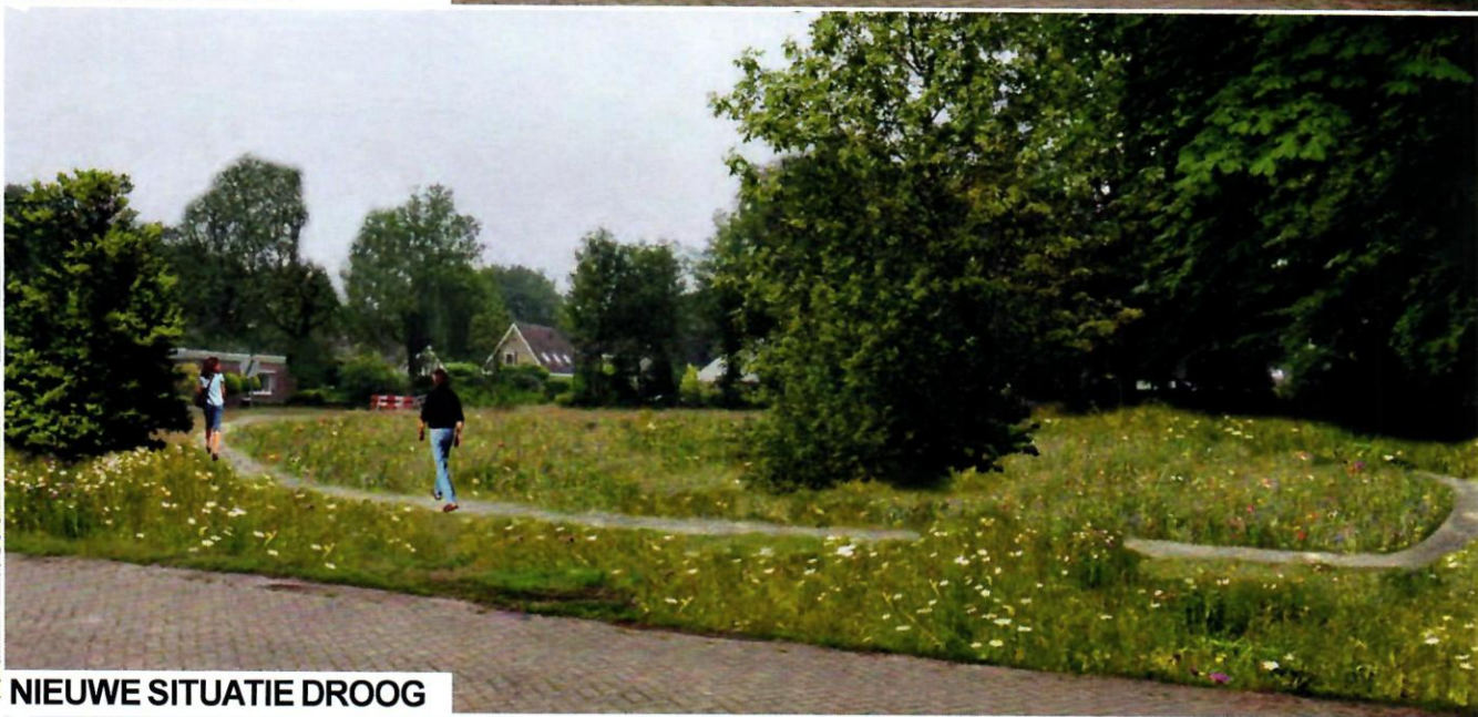
NIEUWE SITUATIE DROOG