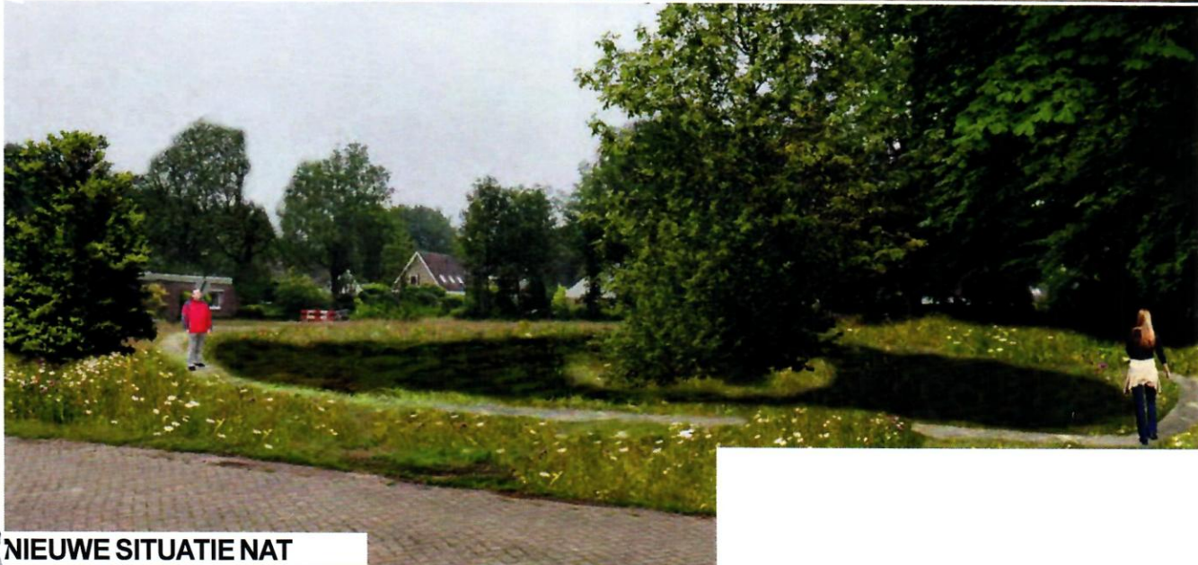
NIEUWE SITUATIE NAT