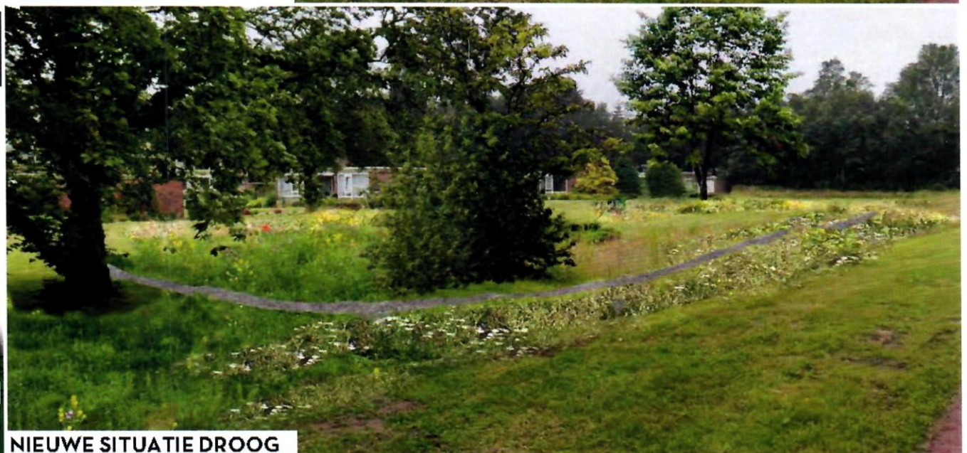
NIEUWE SITUATIE DROOG